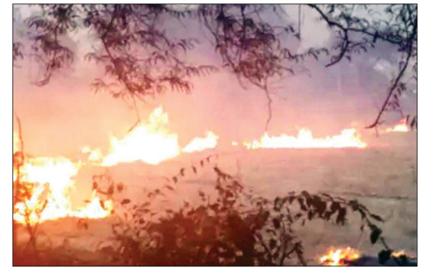
देवास। खेतों में इस तरह नरवाई में लगाई जा रही आग।